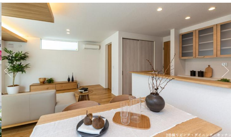
2号棟リビング・ダイニング・キッチン